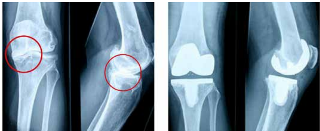
Abb. 3 Schwere Gonarthrose mit Varus-Fehlstellung führen bei 48-jähriger Patientin zu einer doppel-seitigen Knie-TEP Versorgung. Hier ist bei körperlicher Belastung (Skisport) eine Knie- orthesen-Versorgung zur externen Stabilisierung angezeigt.

Der aktive Skifahrer wurde mit einer doppel-seitigen Versorgung ausgestattet. Mit einer bi-lateralen Version konnte eine gute Achskor- rektur und somit eine deutliche Entlastung des lateralen Kniekompartiments erreicht werden.