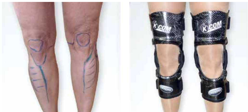
Abb. 4 Die Knieorthesen führen das Gelenk und stabilisieren bei Rotationsbewegungen. Die Patientin trägt die Versorgung bei körperlicher Belastung und beim Sport.