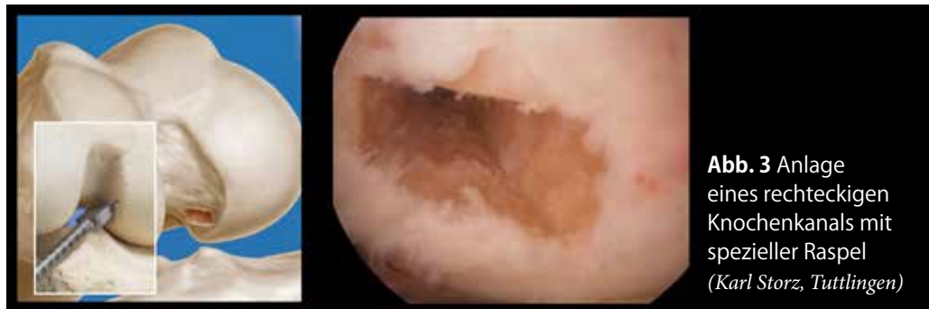
Abb. 3 Anlage eines rechteckigen Knochenkanals mit spezieller Raspel (Karl Storz, Tuttlingen)

ist Facharzt für Unfallchirurgie und Sporttraumatologie und als Mitbegründer am Gelenkpunkt – Sport- und Gelenkchirurgie Innsbruck tätig. Er ist u.a. Teamarzt des FC Wacker Innsbruck und Mitglied des Ärzteteams des ÖSV.