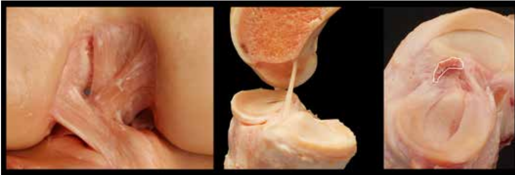
Abb. 2 „Neu Anatomie“ des Vorderen Kreuz- bandes (© Robert Smigielski, PL)

sowie von zahlreichen japanischen Arbeitsgruppen propagiert wird, ist die Beobachtung, dass sich das VKB weniger durch eine runde Bündelstruktur als vielmehr durch seinen flachen Aufbau und seine flache/rechteckige femurale und flache C-förmige tibiale Insertion auszeichnet (Abb. 2). Basierend auf diesen Erkenntnissen kommen neue Operationstechniken, die diesen anatomischen Gegebenheiten