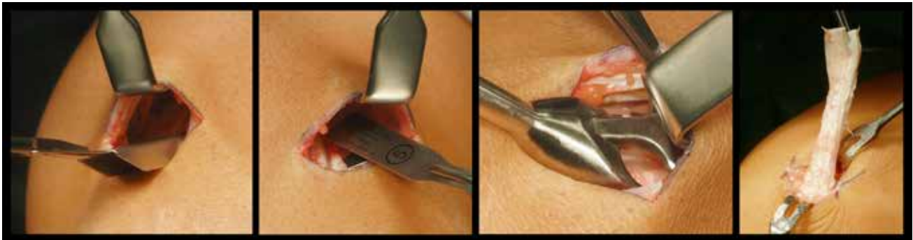
Abb. 1 Minimal-invasive Entnahme der Quadricepssehne (QuadCut® Karl Storz, Tuttlingen)